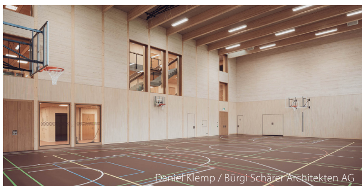
Daniel Klemp / Bürgi Schärer Architekten AG