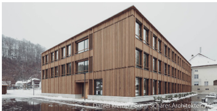
Daniel Klemp / Bürgi Schärer Architekten AG